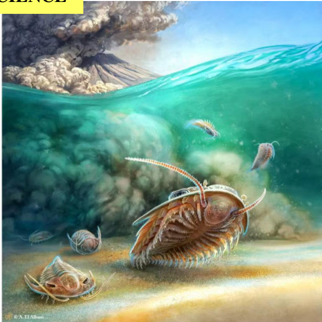
Vue d'artiste de l'explosion du volcan qui a enseveli les trilobites.

Des trilobites, ont été retrouvés pétrifiés dans leur dernière posture, incroyablement bien conservés. Le site d' Aït Youb, dans la région du Souss-Massa au Maroc est un véritable «Pompéi» marin, découvert dans des niveaux de cendres volcaniques. Ces arthropodes fossiles sont les représentants d'un écosystème vieux de 515 Millions d'années (Ma).